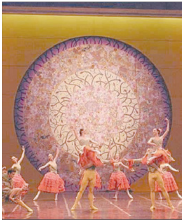
Ballet de l'Opéra National de Bordeaux

Ogni stagione prevede l'ingresso di nuovi lavori nel repertorio, proposte neoclassiche, balletto moderno e danza contemporanea. Parallelamente, si moltiplicano le tournées: Giappone, Stati Uniti, Spagna, Italia, e le recite in prestigiosi teatri a Parigi, Kiev, Lo-